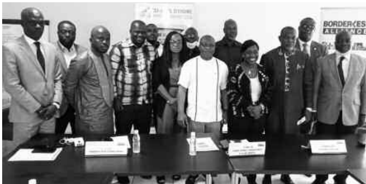
Les impacts du plaidoyer de Borderless ont été salués par tous.

chaîne de transport pour répondre aux grands enjeux en matière de transport, en effectuant des actions de plaidoyer, diffusant des données et en menant des discussions multilatérales. Concernant les activités, le président Jonas Lago a présenté une série d'actions menées par l'Alliance Borderless en 2020 et