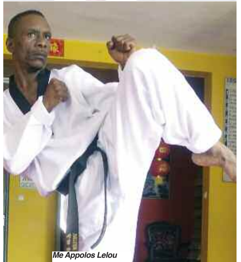
Me Appolos Lelou

Le temple du taekwondo national, le centre sportif ivoiro-coréen baptisé temple Alassane Ouattara, inauguré aujourd'hui