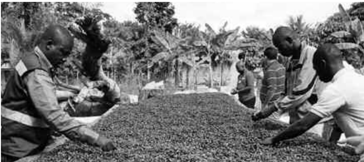
La campagne cacaoyère 2021-2022 peut-elle éviter le syndrome de 2020-2021 ?

"Nous sommes d'accord pour les 825 FCFA, quoiqu'ils soient de 975 FCFA au Ghana. Mais il faudrait que ce prix soit respecté et que la campagne ne s'arrête pas après deux ou trois mois d'activité comme on le constate généralement". C'est entre joie et crainte qu'à