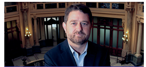
CLAUDIO ORREGO Intendente Metropolitano

Hablamos de un rediseño integral del espacio público y la infraestructura de transporte que se extenderá por más de 12 kilómetros desde Tobalaba hasta Pajaritos, integrando a su paso a las comunas de Lo Prado, Estación Central, Santiago y Providencia. Esto es un reto interdisciplinario y de planificación gigantesco para mejorar las condiciones de movilidad y accesibilidad del eje, favoreciendo la convivencia e integración de los distintos modos de transporte como buses, metro, bicicleta y el propio peatón, pero al mismo tiempo con diseño urbano, ingeniería, paisajismo,