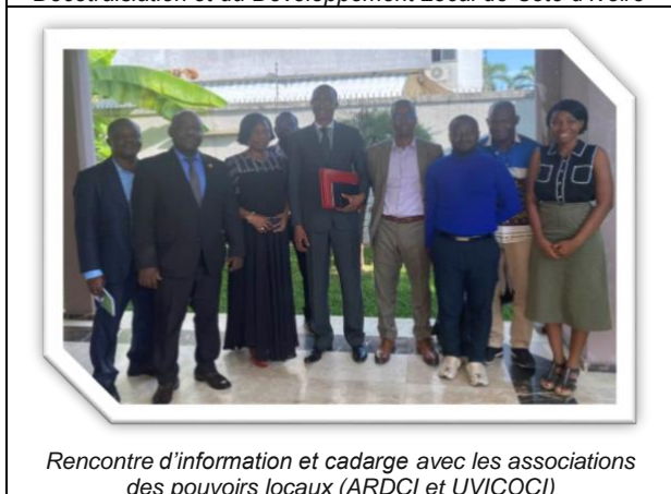
Rencontre d'information et cadrage avec les associations des pouvoirs locaux (ARDCI et UVICOCI)