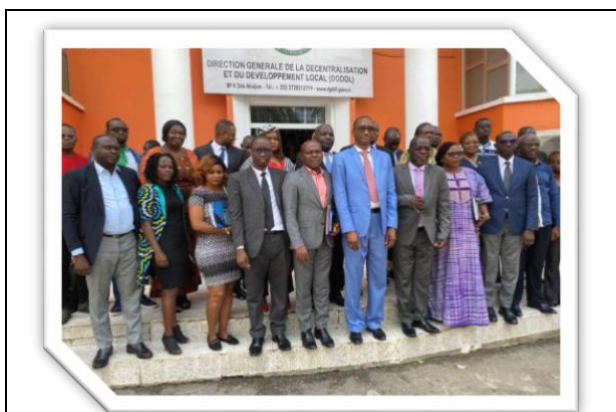
Rencontre de cadrage avec la Direction Générale de la Décentralisation et du Développement Local de Côte d'Ivoire