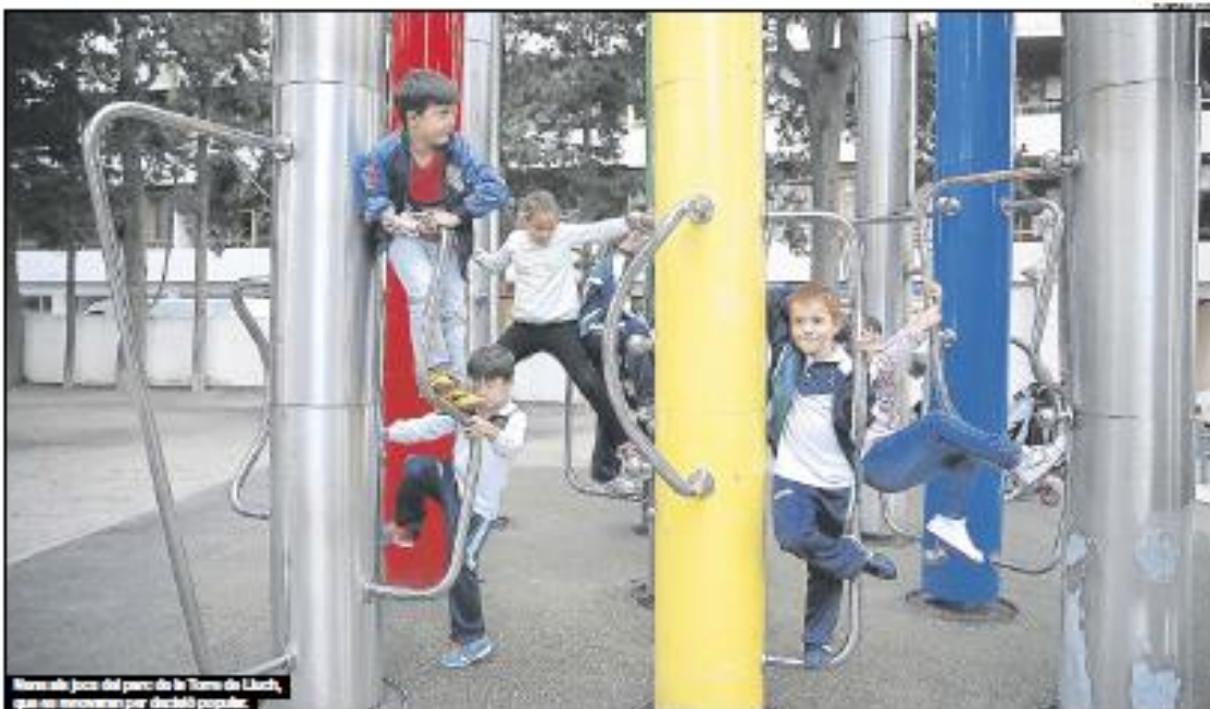
Hi ha els jocs del parc de la Torre de Llobregat, que es renovaran per decisió popular.