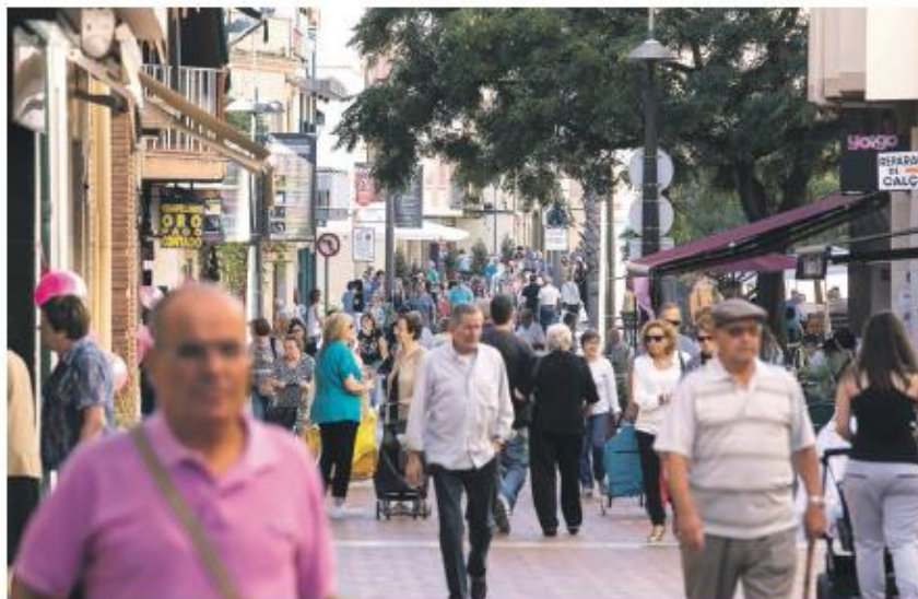
La ciutadania ha escollit 20 projectes d'entre les 54 intervencions de millora plantejades pels serveis tècnics municipals, gavanencs i gavanenques i entitats

Les propostes no vàlides ho van ser perquè el seu cost superava els 35.000 euros, o perquè plantejaven altres tipus d'actuacions no vinculades a la millora de l'espai públic. Tots els ciutadans i les ciutadanes que van presentar propostes van rebre resposta