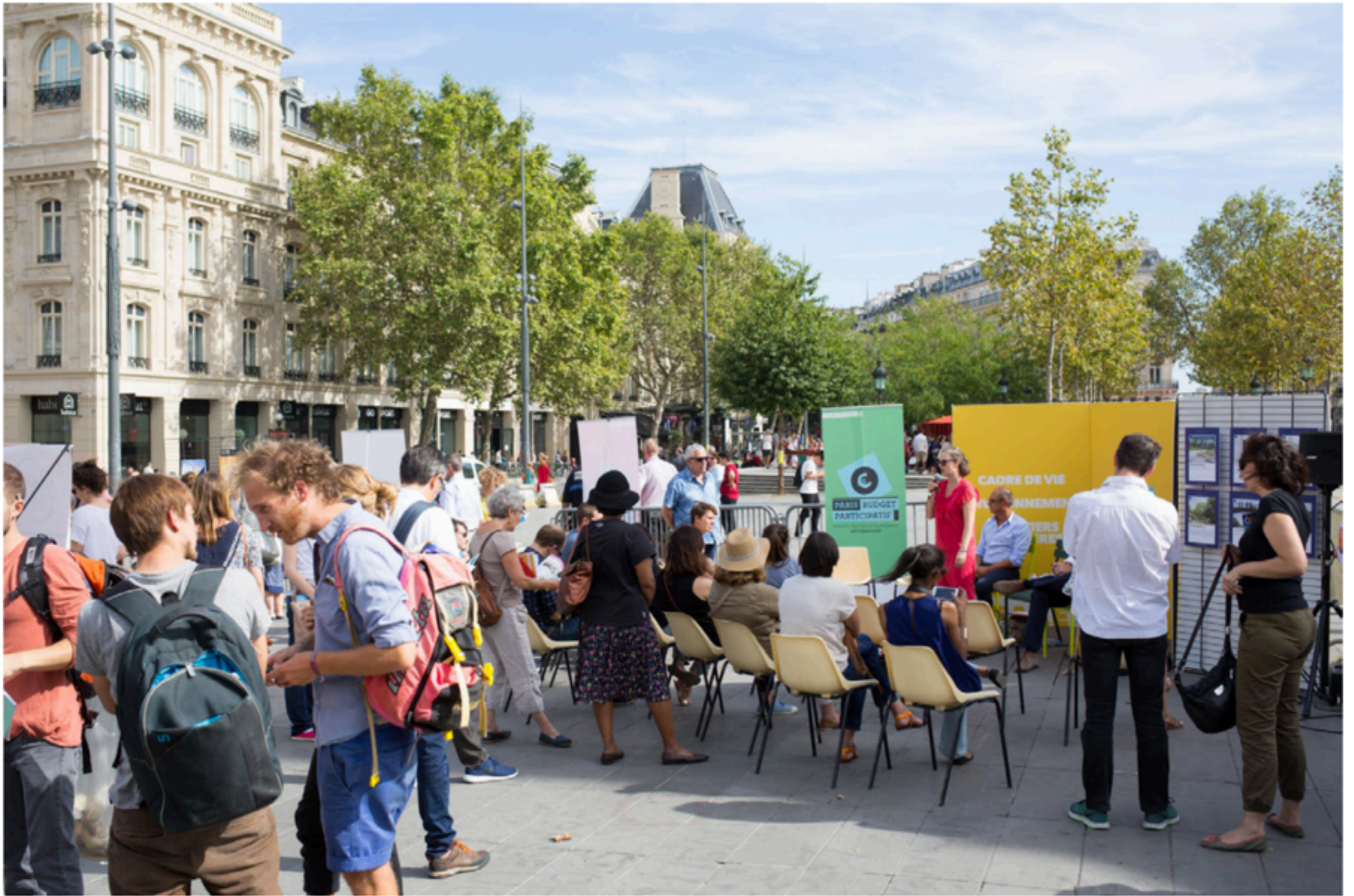
Public presentation and vote for 2016 PB projects.

Des-digitalizar los presupuestos Participativos > preservar la dimensión deliberativa, el voto y la voz