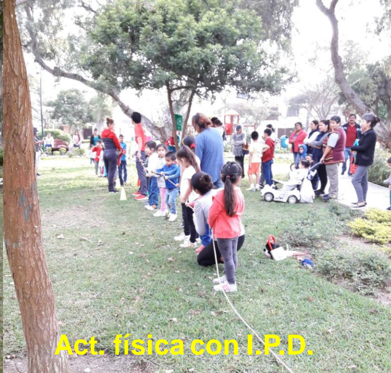
Act. física con I.P.D.