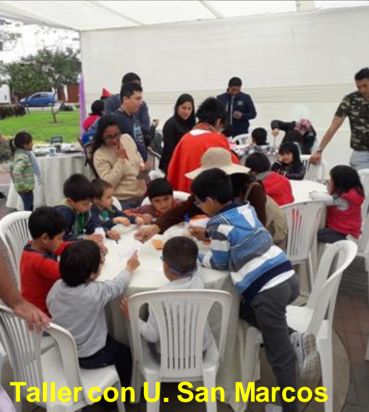
Taller con U. San Marcos