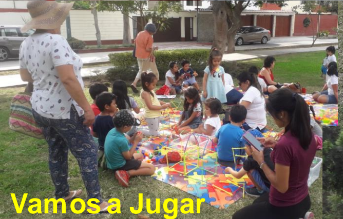
Vamos a Jugar