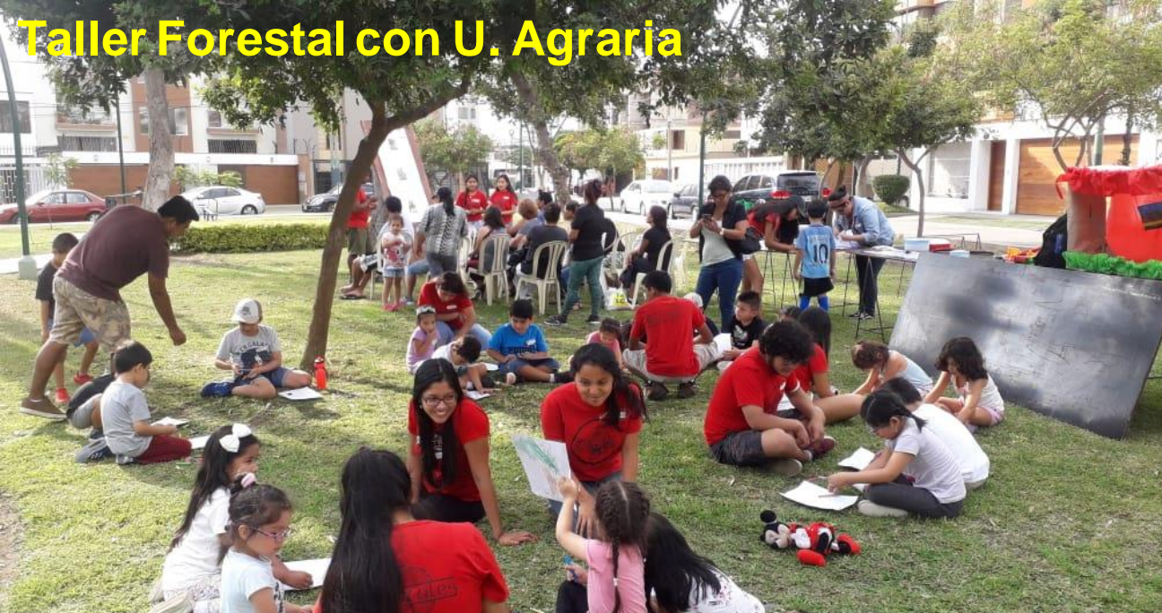
Taller Forestal con U. Agraria