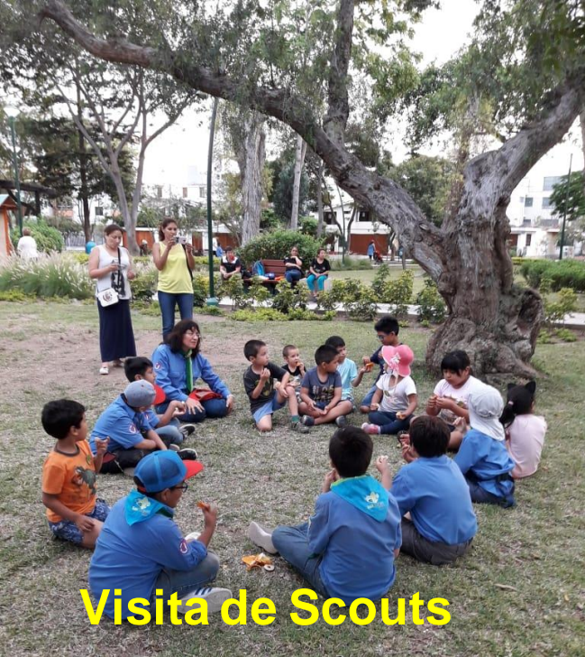
Visita de Scouts