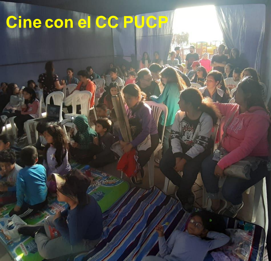
Cine con el CC PUCP