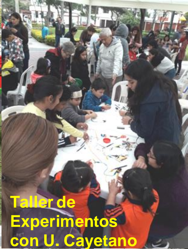
Taller de Experimentos con U. Cayetano