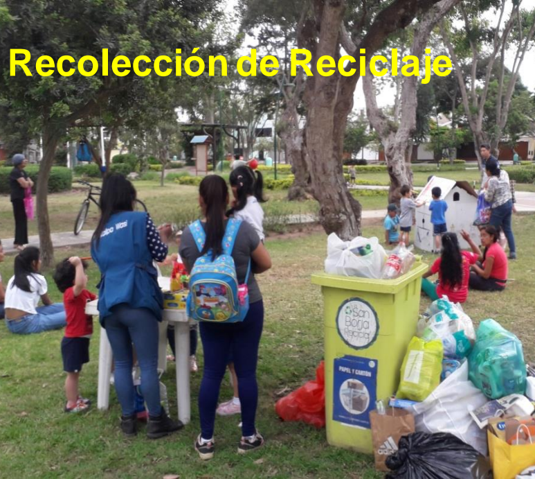
Recolección de Reciclaje