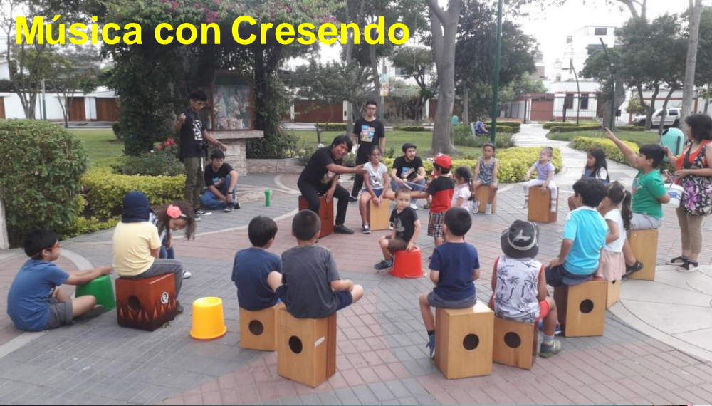
Música con Crescendo