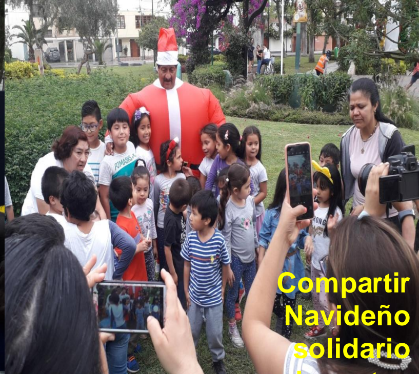
Compartir Navideño solidario juguetes Hospital del Niño