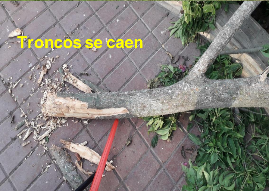
Troncos se caen