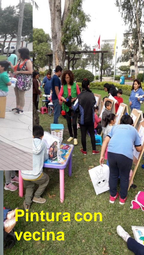
Pintura con vecina