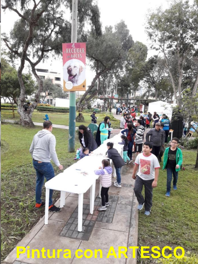
Pintura con ARTESCO