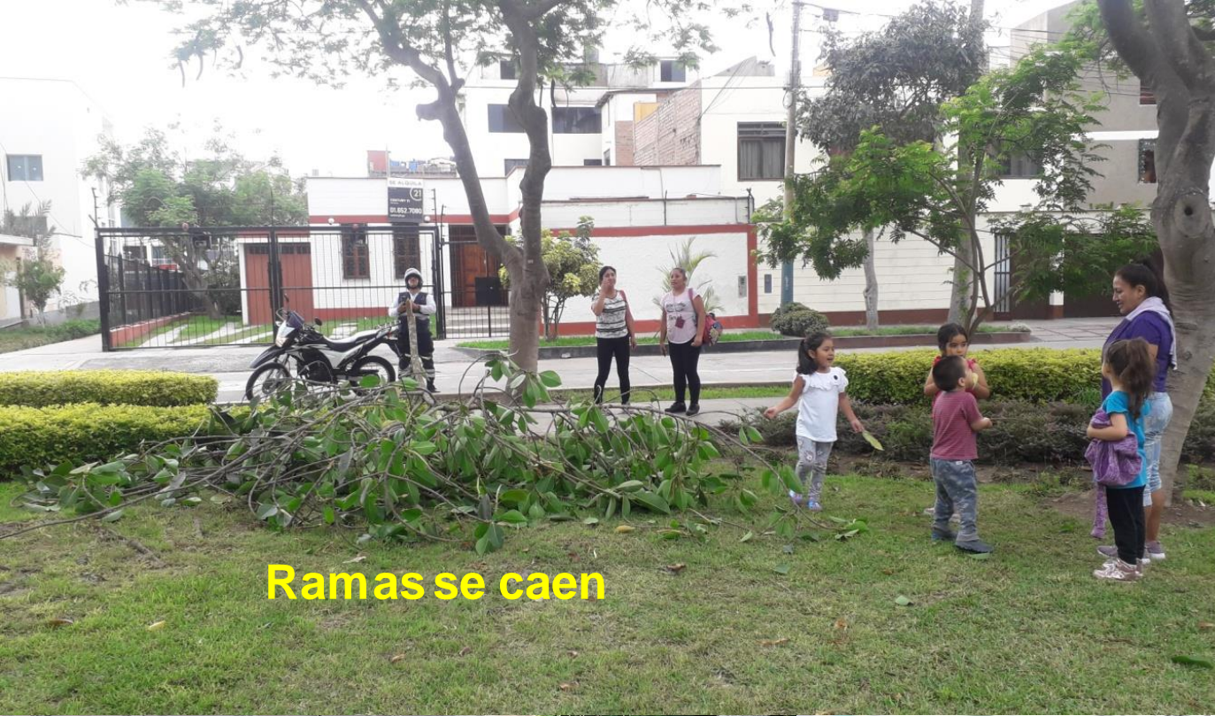
Ramas se caen