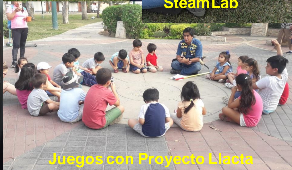
Juegos con Proyecto Lacta