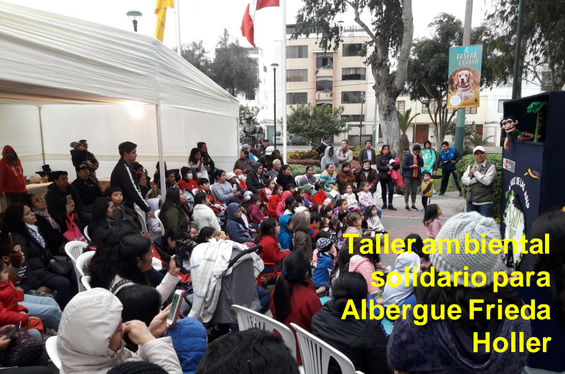
Taller ambiental solidario para Albergue Frieda Holler