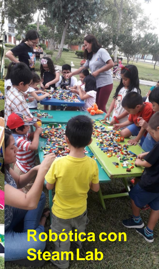
Robótica con Steam Lab