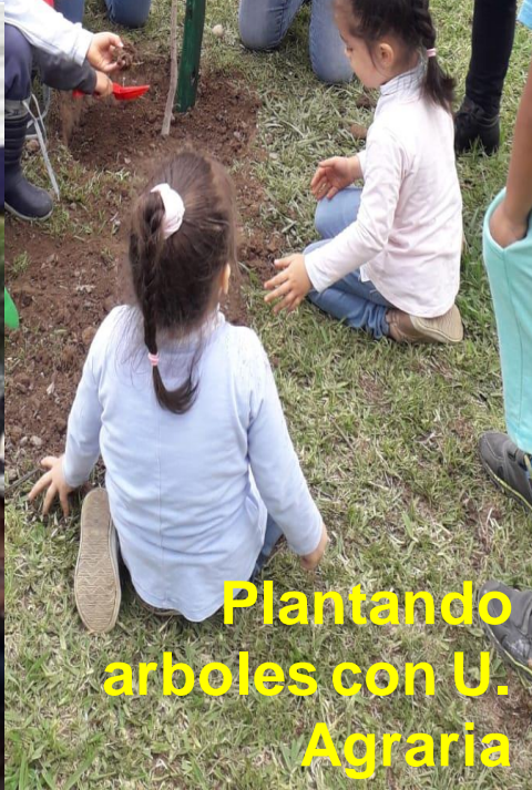
Plantando arboles con U. Agraria