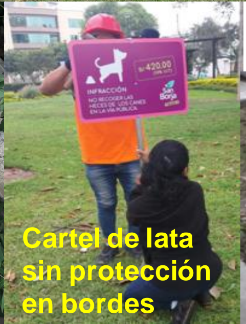
Cartel de lata sin protección en bordes