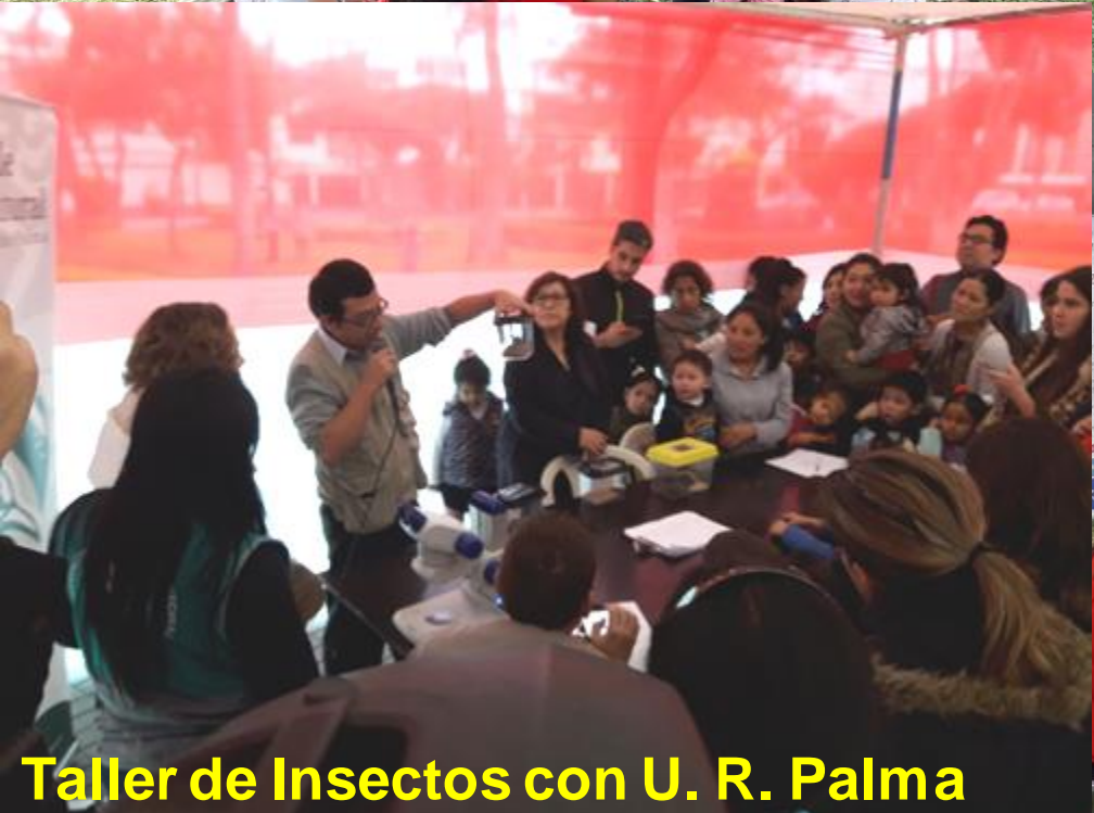
Taller de Insectos con U. R. Palma