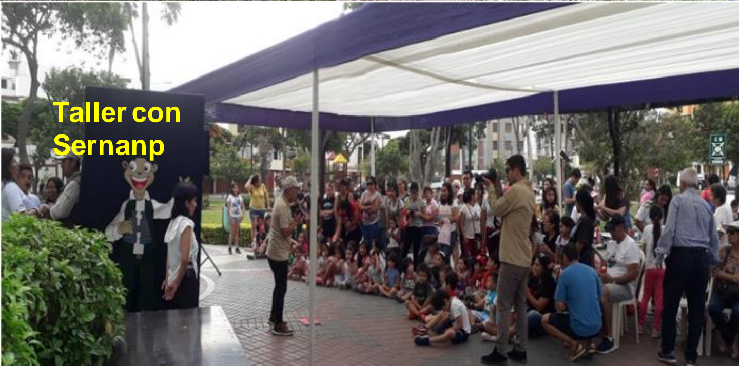
Taller con Sernanp