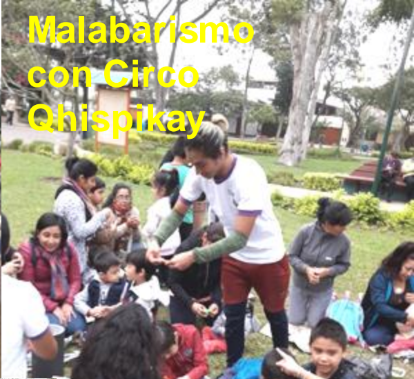
Malabarismo con Circo QhispiKay