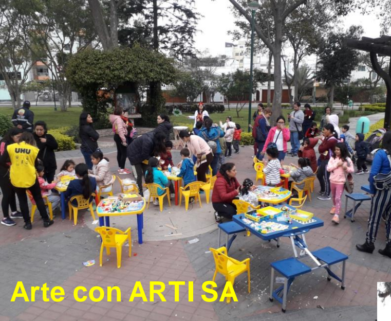
Arte con ARTISA