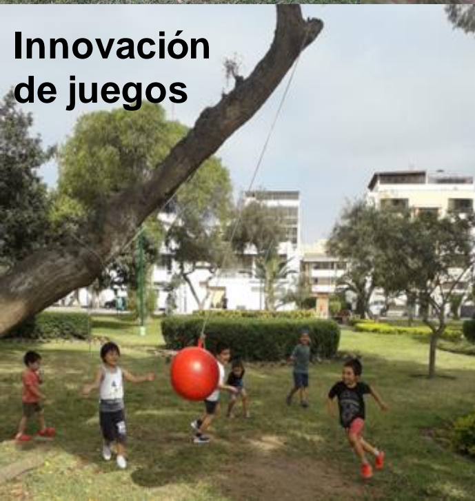
Innovación de juegos