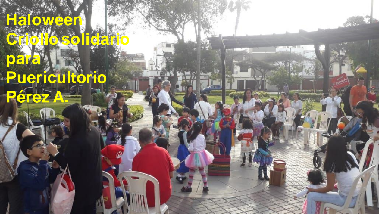
Haloween Criollo solidario para Puericultorio Pérez A.