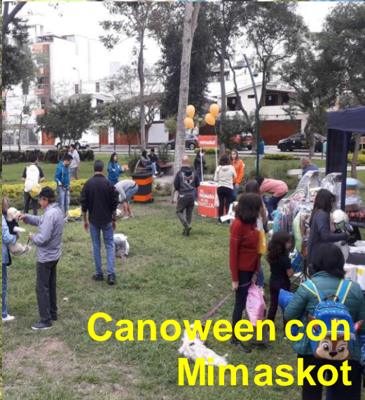
Canoween con Mimaskot