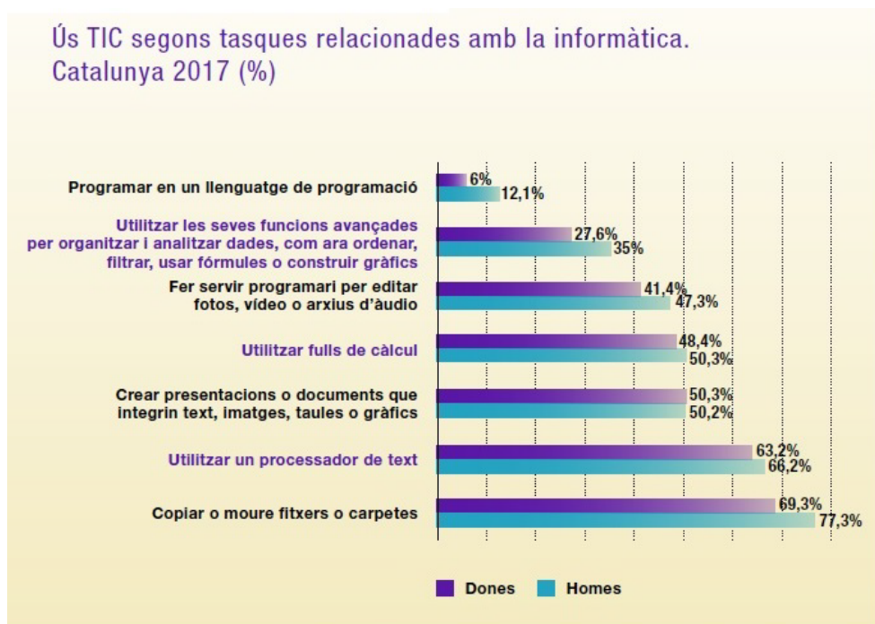
Gràfic 2. Ús TIC segons tasques relacionades amb la informàtica. Catalunya 2017 (%).

En aquest sentit, l'Observatori de la Igualtat de Gènere (OIG) elabora un dossier estadístic anomenat Les dones a Catalunya 2019 , en el qual manifesta que, l'any 2017, les dones mostraven un ús de les noves tecnologies inferior als homes, segons la tipologia de tasca que duïen a terme. Així, a mesura que augmentava la complexitat de la tasca a desenvolupar, el percentatge de dones que realitzava la mateixa disminuïa, augmentant així la diferència amb els homes (vegeu gràfic 2).